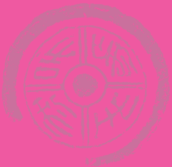
十三、福如東海 壽比南山